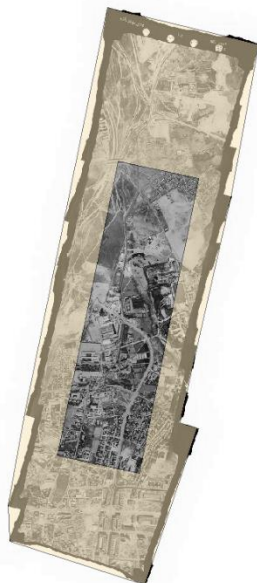
Ámbitos de exclusión en color marrón.

ACC_AE_shp_1964.shp: En este SHP está el ámbito de exclusión de control de calidad por falta de vuelo.